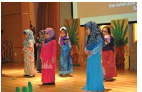
Program Hari Penjaja & Peniaga Kecil Peringkat Negeri Sembilan 21- Disember 2013