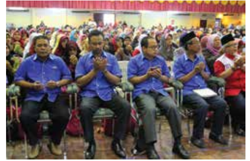
Program Mesra KPDNKK Bersama Masyarakat - 17 Oktober 2013