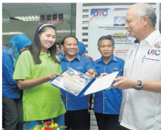
PERDANA Menteri, Datuk Seri Najib Tun Razak menyempahkan Sijil Pendaftaran Perniagaan ketika melawat pejabat cawangan SSM di UTC Kedah.