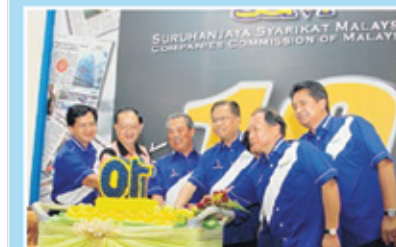
TIMBALAN Perdana Menteri, Tan Sri Muhyiddin Yassin (tiga dari kiri) meraikan Sambutan Ulang Tahun ke-10 SSM pada Majlis Persembahan Program Outreach SSM Zon Selatan di Puchong, Johor.