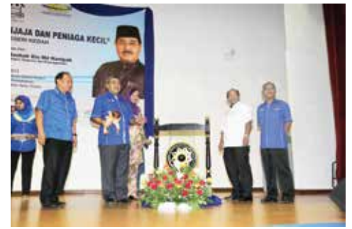
KPPPK Terengganu - 9 September 2013