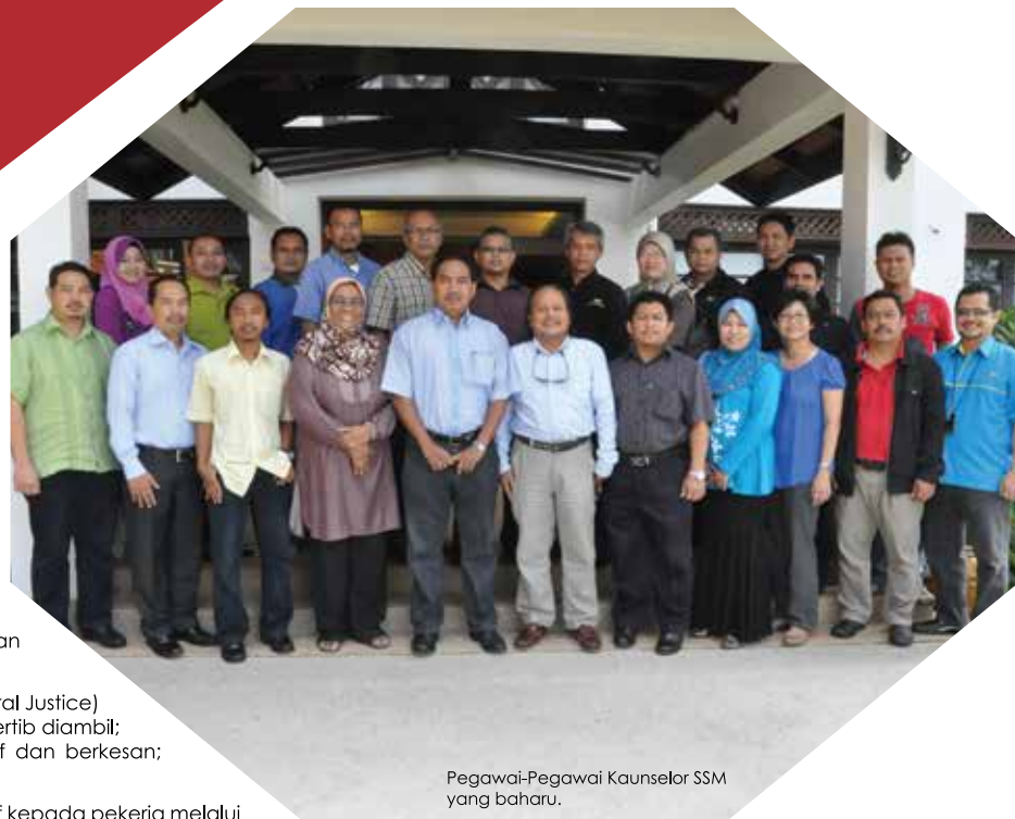
Pegawai-Pegawai Kaunselor SSM yang baharu.

Peserta peserta yang terlibat dalam program ini adalah seramai 22 orang yang terdiri dari pelbagai Bahagian dan Pejabat SSM Negeri di seluruh Negara yang mana mereka dipilih berdasarkan kriteria-kriteria tertentu yang telah ditetapkan bagi menjalankan tanggungjawab sebagai kaunselor di tempat bekerja mereka masing-masing. Program ini telah dijalankan pada 24 – 26 Oktober 2013 bertempat di Avillion Port Dickson, Negeri Sembilan.