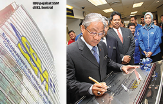
DATUK Hasan Malek merasmikan Pusat Perkhidmatan Perniagaan SSM ketika melawat Menara SSM@KL Sentral.