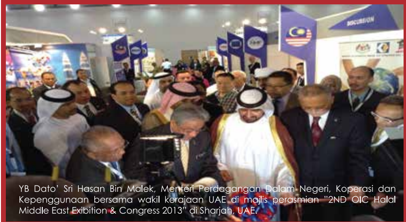
YB Dato' Sri Hasan Bin Malek, Menteri Perdagangan Dalam Negeri, Koperasi dan Kepenggunaan bersama wakil kerajaan UAE di majlis perasmian "2ND OIC Halal Middle East Exhibition & Congress 2013" di Sharjah, UAE.