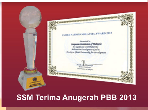
SSM Terima Anugerah PBB 2013

SEMINAR KEBANGSAAN MENGENAI PENCEGAHAN PENGUBAHAN WANG HAR PENCEGAHAN PEMBIAYAAN KEGANASAN