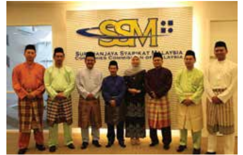
Majlis Aidilfitri & Kemerdekaan KPDNKK - 01 September 2013