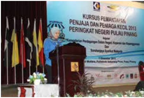
KPPPK Penang - 7 Disember 2013