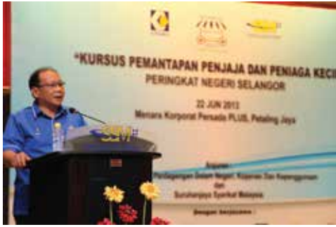
KPPPK Selangor - 22 Jun 2013