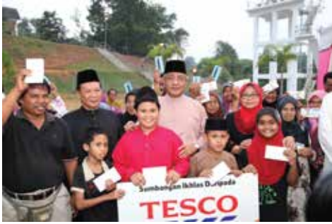
Program Majlis Berbuka Puasa YBM PDNKK - 01 Ogos 2013